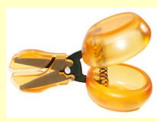
カスタンネット型はさみ